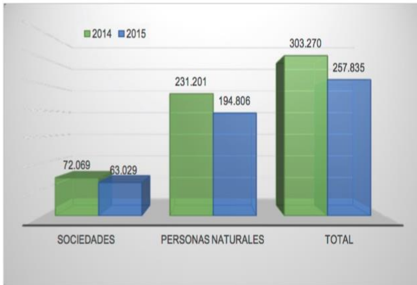
Gráfico 1. Total unidades productivas creadas, 2015/14